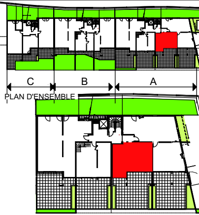
PLAN BATIMENT A