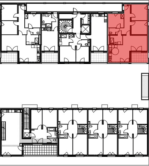
PLAN DE REPERAGE