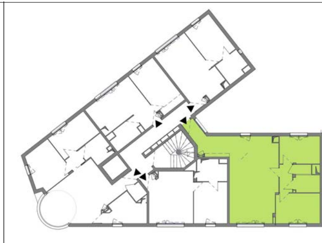
PLAN DE REPERAGE